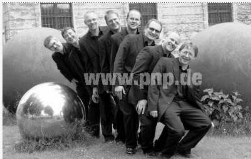
Das beliebte Männer-Ensemble „Konradis“.